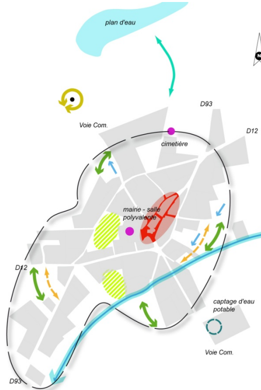
Schéma d'illustration du parti d'aménagement et de développement durables : principes généraux de situation